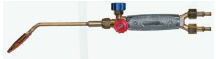
КЕДР Г-2А Малютка