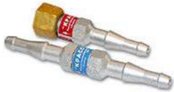
Обозначение 3К или 3Г – на вход резака/горелки

Предохранительные устройства устанавливаются как на вход резака или горелки, так и в разрыв рукавов; конструктивно выполнены с правыми присоединительными (кислород, маркируются синим цветом) или левыми (горючий газ, маркируются красным цветом) резьбами.