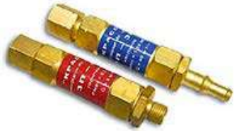
Обозначение 1К или 1Г – на выход редуктора