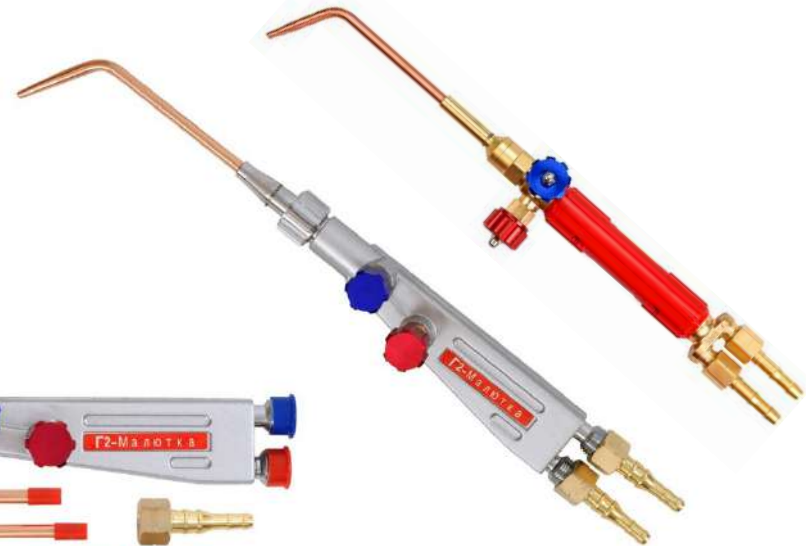
КЕДР Г-2 Малютка